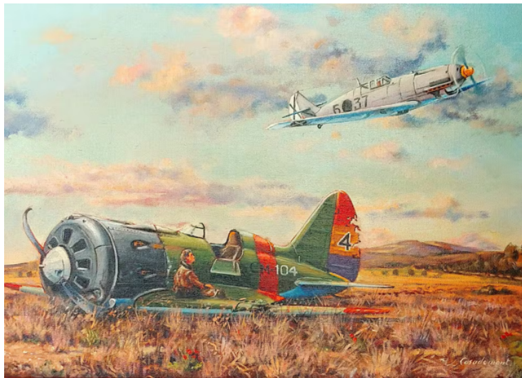
Un Mosca y un Me-109 en una de las pinturas del fondo Vilella que se exponen en el aeropuerto de El Prat.