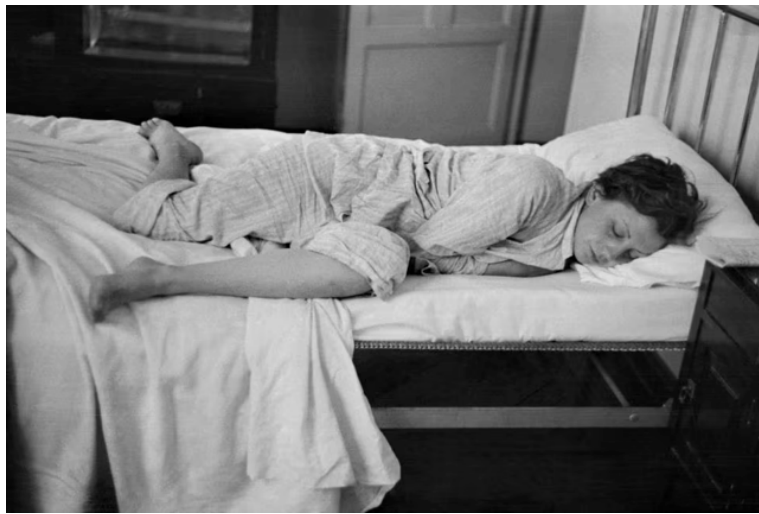
La fotografía de guerra Gerda Taro.

foto controvertida que al parecer es ella: la muestra moribunda, sangrando por la nariz y la boca, atendida por un médico polaco en un camastro. Contrasta dramáticamente con otra foto de los tiempos bohemios en París en la que se la ve dormida plácidamente en pijama y que era de las preferidas de Robert Capa .